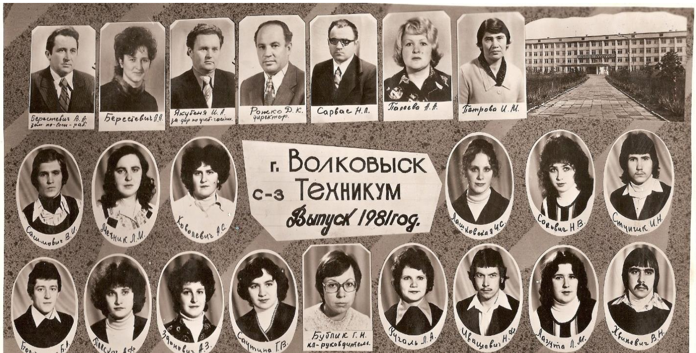
Выпуск 1981 год