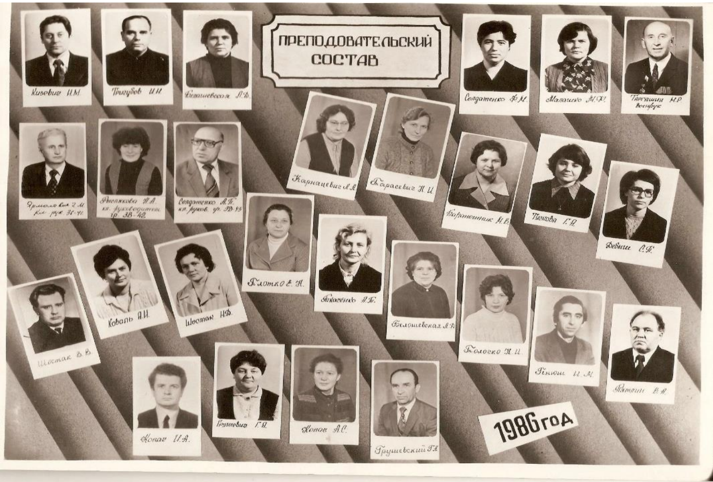
Преподавательский состав 1986 год