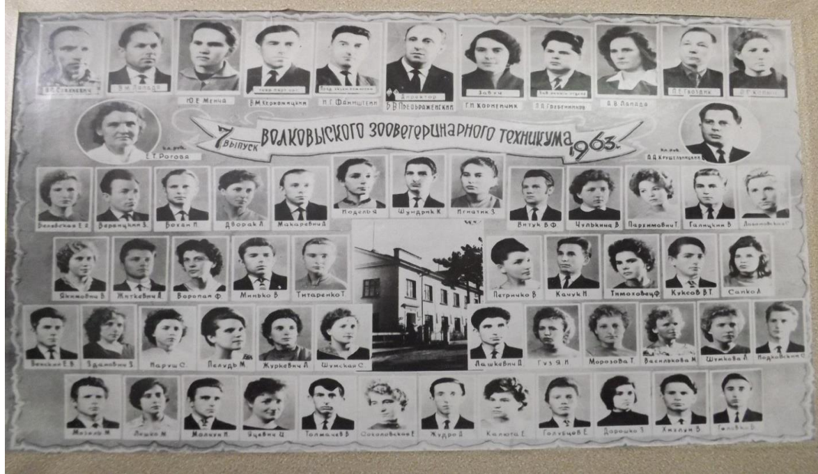
Выпуск 1963 года