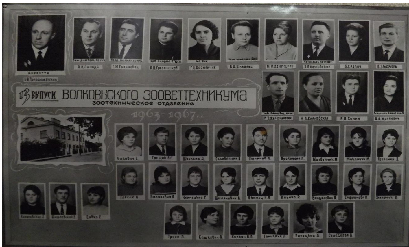
Выпуск 1967 года, зоотехническое отделение