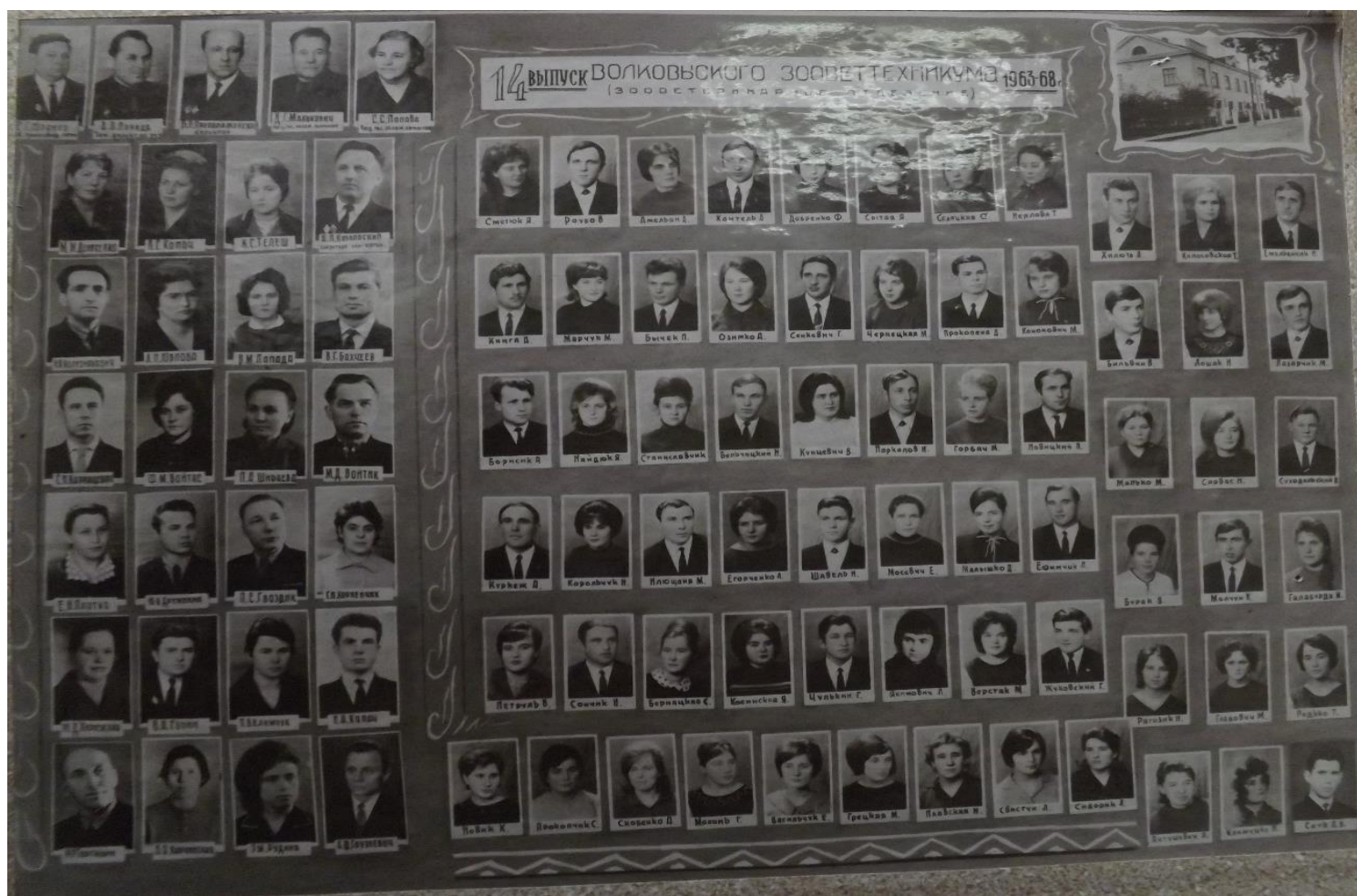
Выпуск 14 –ый - 1968 год, зоотехническое отделение