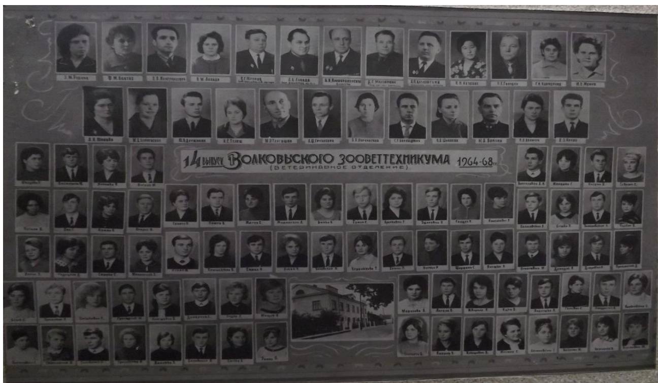
Выпуск 1968 год, ветеринарное отделение

1970 год – в связи с упразднением Гродненского зоотехникума осуществлен перевод всех его учащихся в Волковысский зооветеринарный техникум.