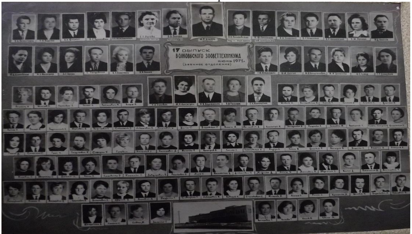
Выпуск 17-ый - 1971 год, зоочное зоотехническое отделение