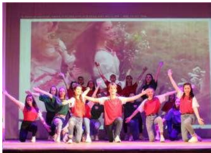
Группа современного танца