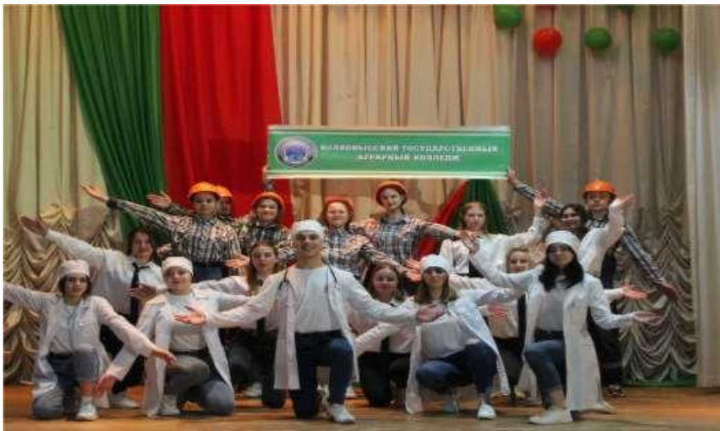
Проориентационный отряд «Профнавигатор»