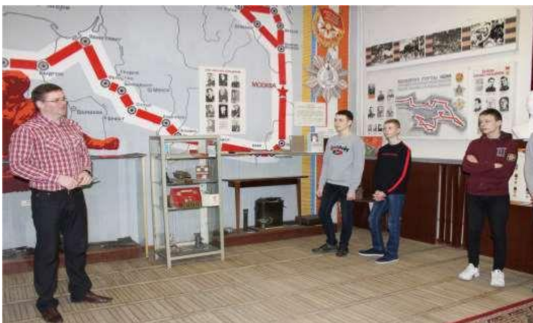
Музей Боевой Славы