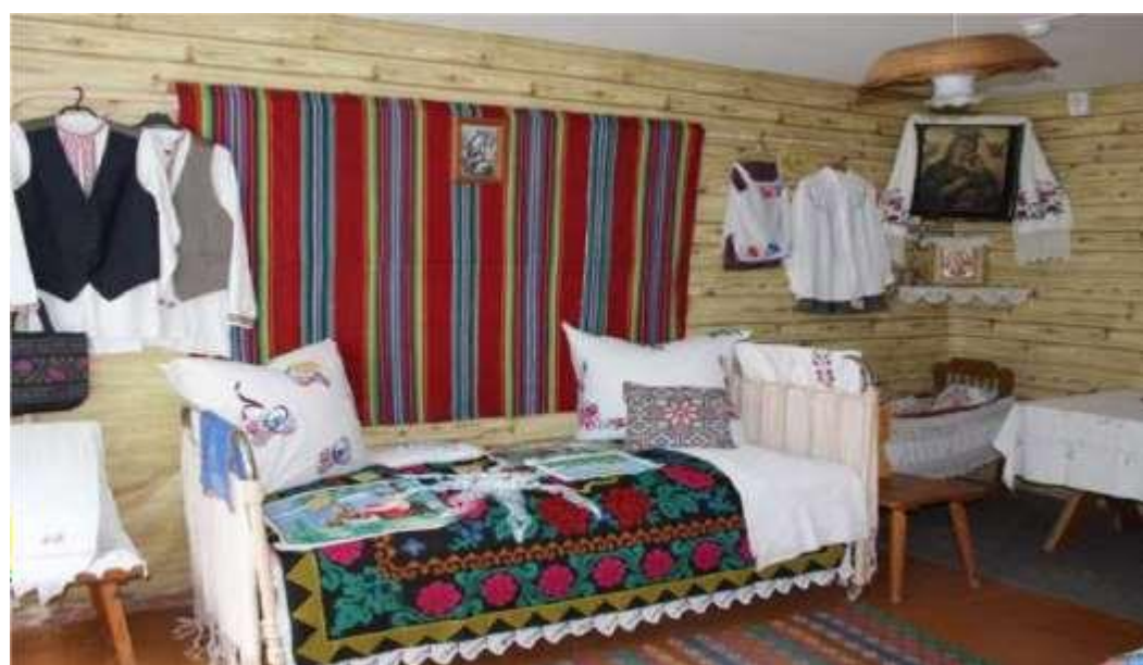
Краеведческий уголок «Беларуская хатка»