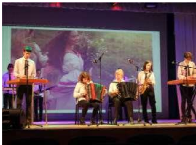
Оркестровая группа «Гармония»

Создана знаменная группа по выносу и вносу Государственного флага, патриотический клуб «Гранит», клуб «Дрэва жыцця». На базе колледжа функционирует музей Боевой Славы, этнографический и анатомический уголки, на базе общежития – краеведческая комната «Беларуская хатка». Издаётся малотиражная газета “Белыя ветразі”.